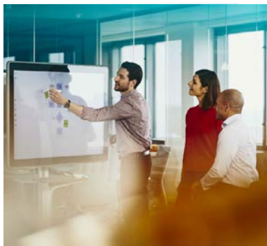
Programa Upskilling por áreas